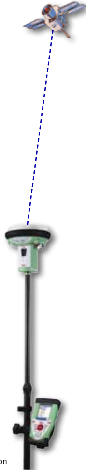
GPS - Station